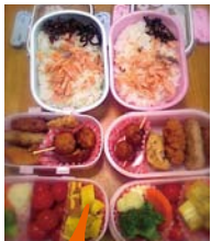
娘たちのバスケットボールの試合の為に作ったお弁当。二段おかず&鮭ご飯。