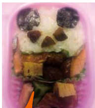
パンダ弁当。三女のリクエストで作りました。プチマトで色気をだせばよかった。