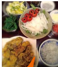
「ある日の晩ご飯」。鶏の天ぷら、大根サラダ、ジャコおろし、スナックえんどう、明太子、白菜の漬物です!